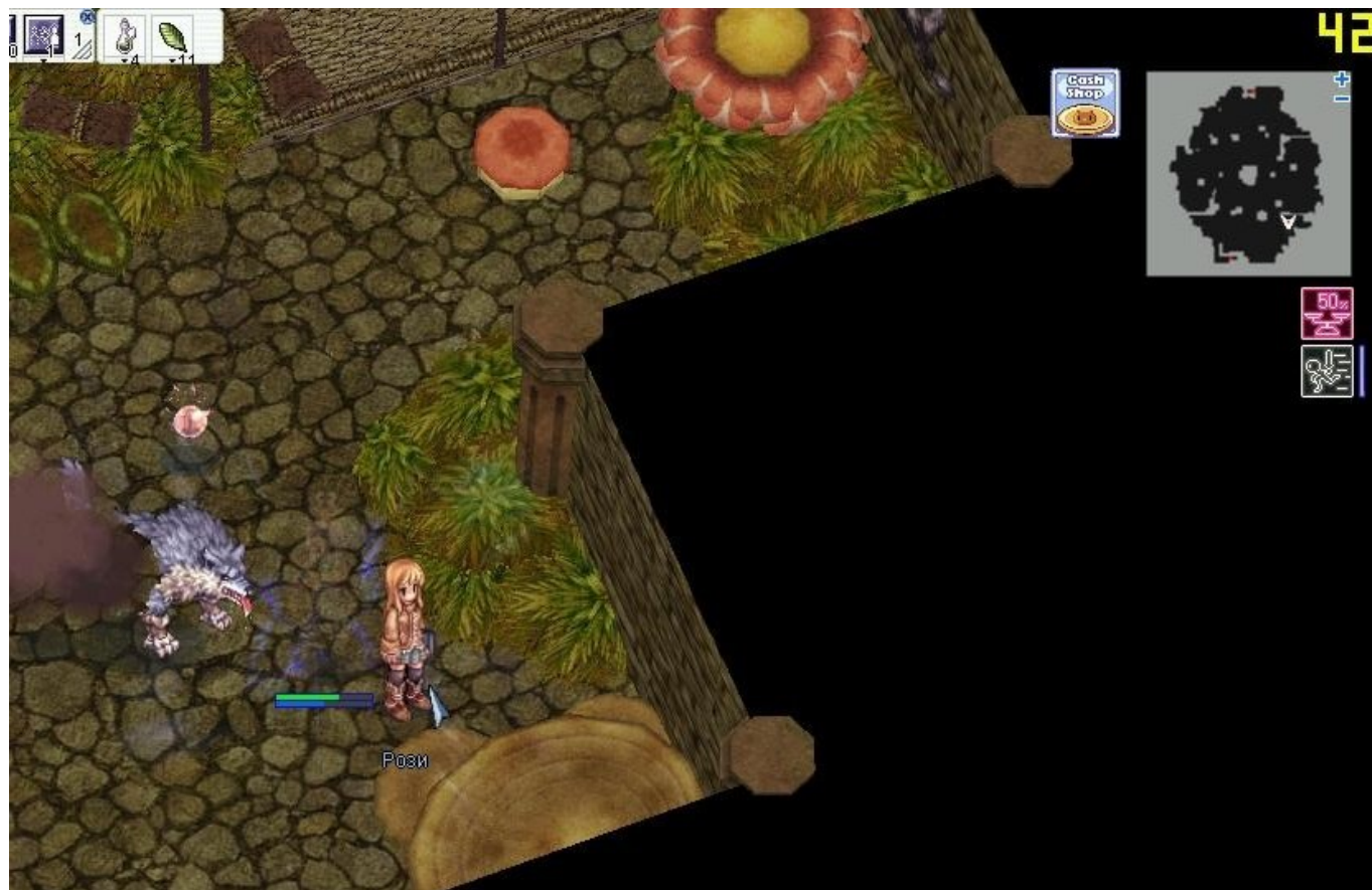
Третий же застрял в башне совсем надолго, добравшись до третьего этажа. (Советую запомнить его, в дальнейшем нам придется подкармливать бедолагу ежедневно)