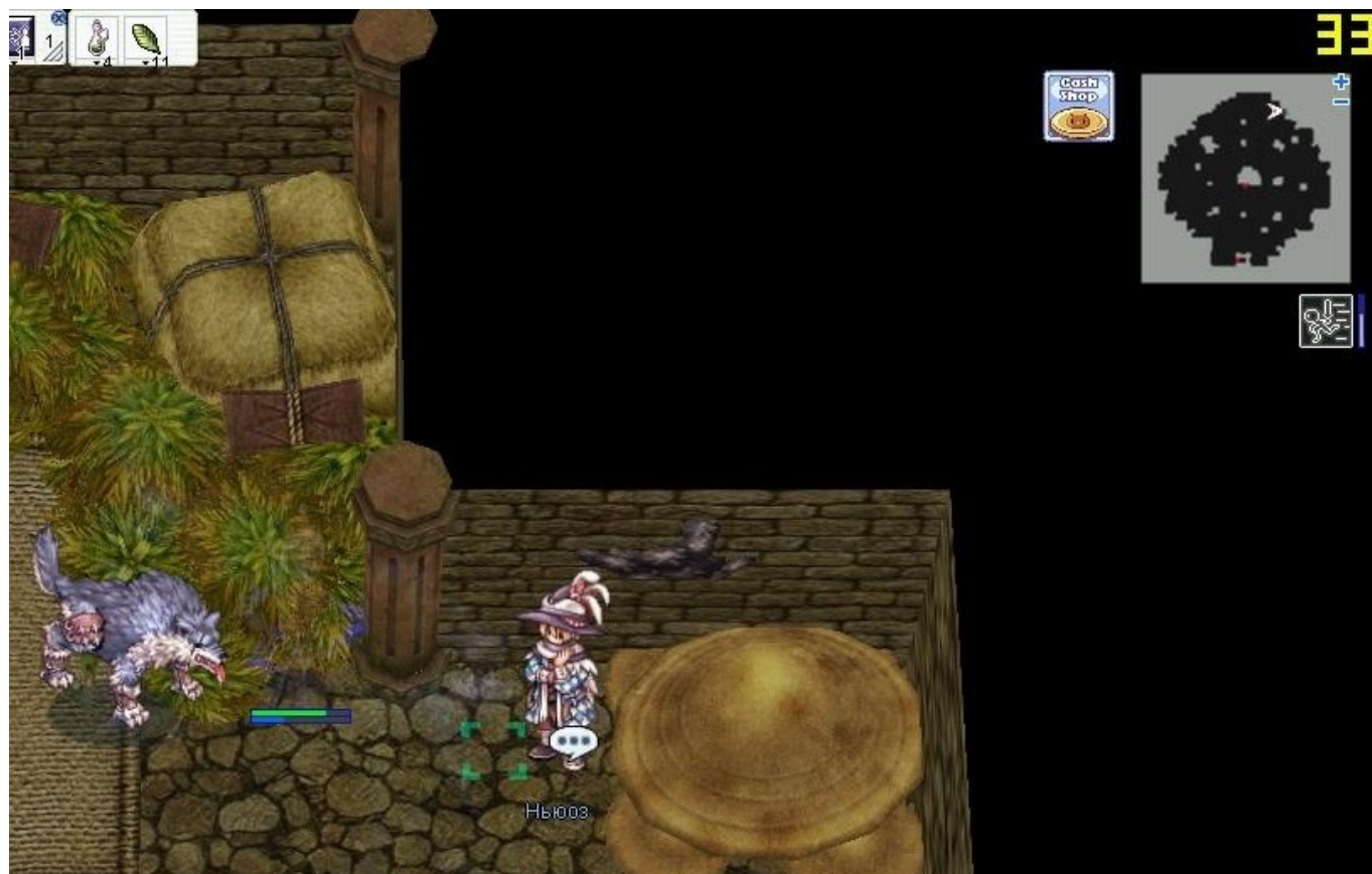
После всей беготни в башне возвращаемся к Филли и получаем награду. А также - возможность ежедневно выполнять квесты «Лафины, любящие землю» и «Приветствие путников» за одну монетку Терры.